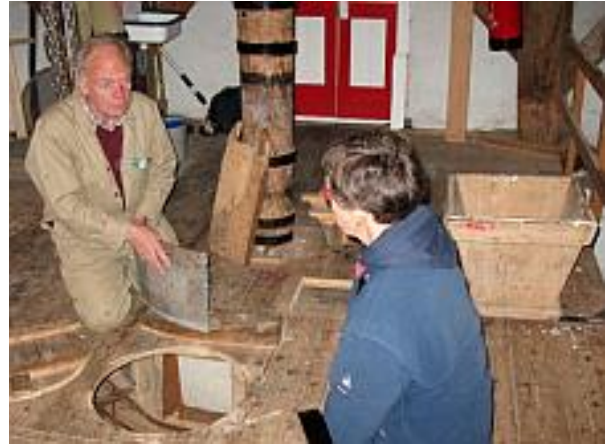
Uitleg over het pellen van gerst of rijst