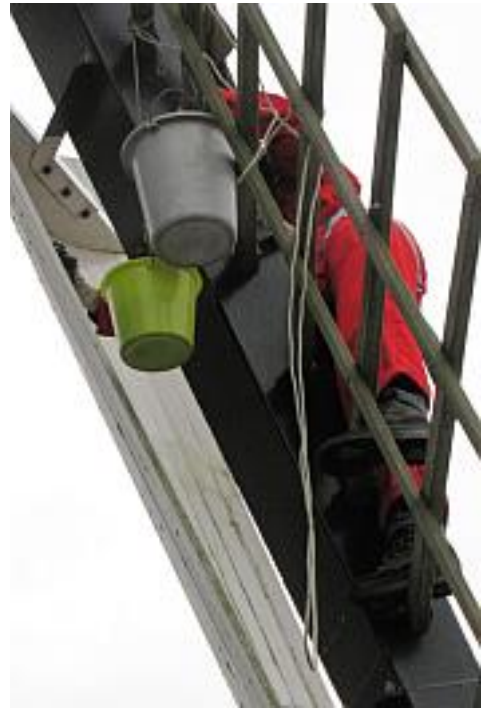
Boenen van de fokwieken op NL Doet-dag