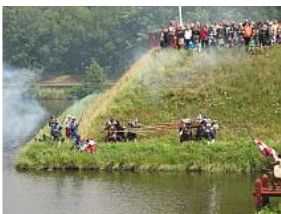
Slag om Bourtange