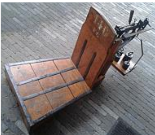
Bascule van de voormalige FG-suikerfabriek