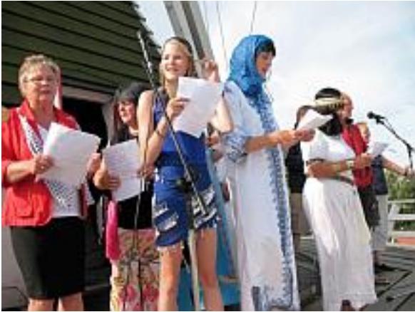
Koor op de molen in Noordhorn: het leukste dorp van Groningen