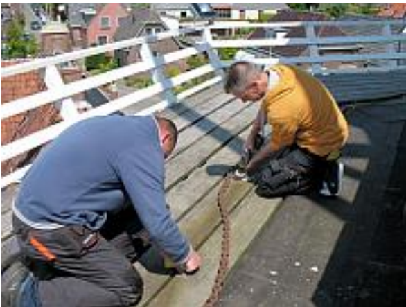
Aspirant-molenaars plegen onderhoud