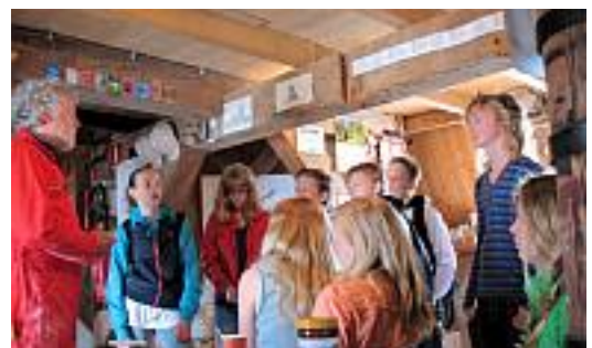
Lauwerscollege-2D krijgt rondleiding