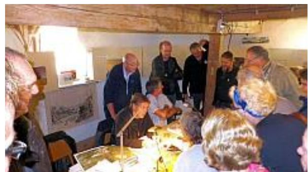
Vondsten-determinatiemiddag goed bezocht