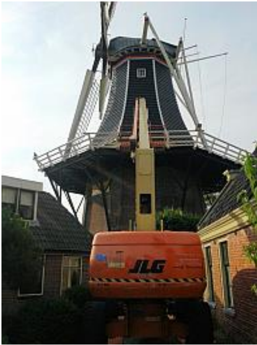
Groot onderhoud met hoogwerker