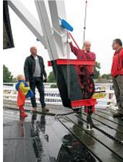
Publiek op Open monumentendag